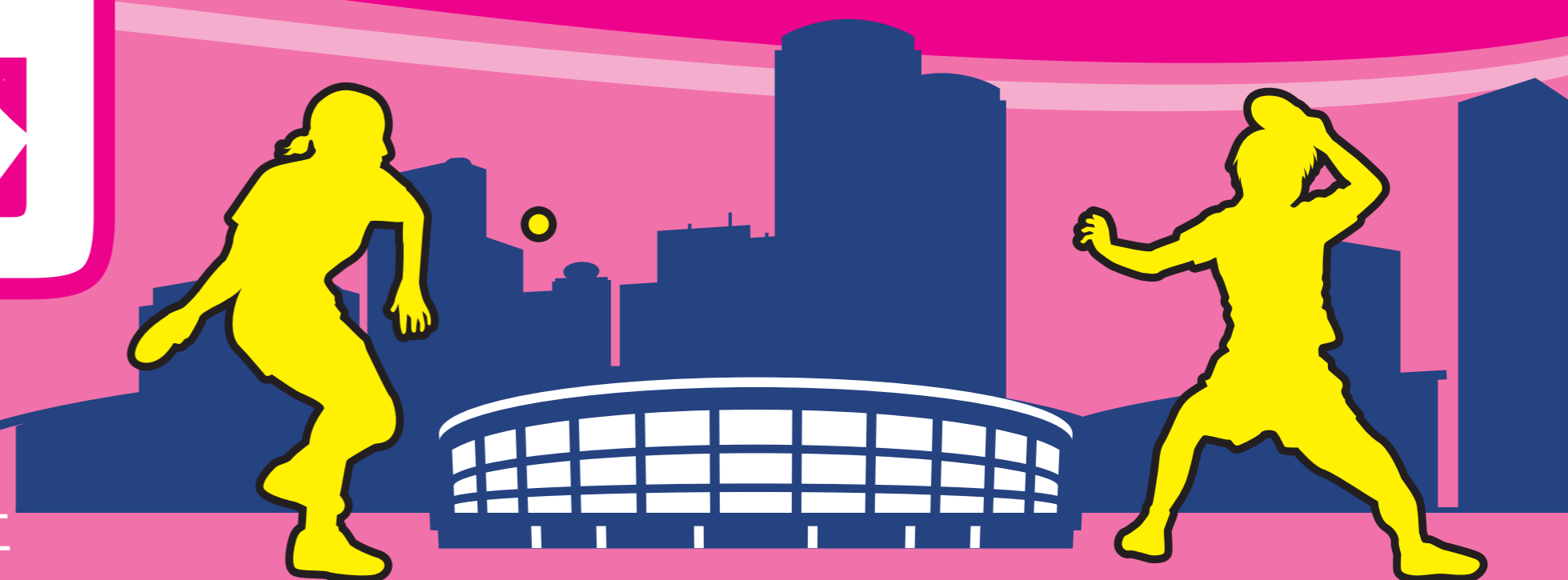
Table Tennis Park Guide